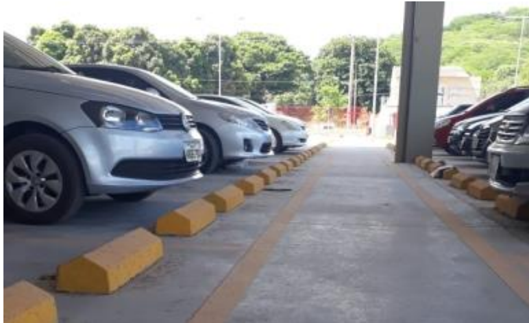
Imagem 08: referência para bate rodas.

Obs: Os bate rodas deverão ser previamente pintados de amarelo.