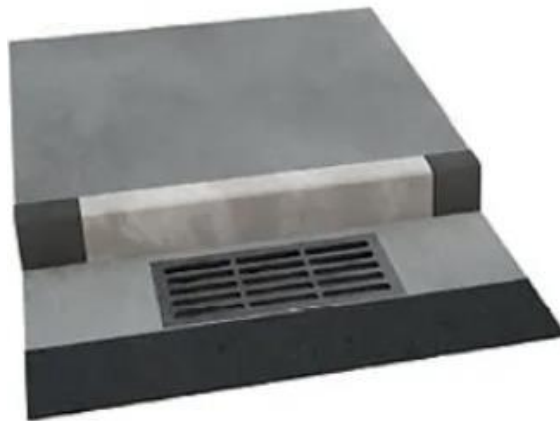
Imagem 02: referência para execução de boca de lobo com grelha de ferro fundido.

6ª etapa: As bocas de lobo com grelhas de ferro fundido, com dimensão 30x100cm serão locadas nas sarjetas (com 30cm de largura) e a captação deverá feita conforme referência abaixo: