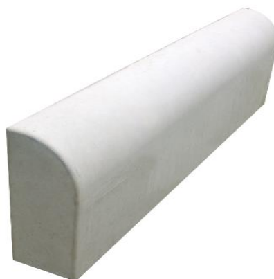
Imagem 03: meio fio liso em concreto pré-moldado, 08x25x80cm.

7ª etapa: Para confinamento do estacionamento, será utilizado meio fio em concreto pré-moldado do tipo liso, nas dimensões 08x25x80cm (espessura x altura x largura), sendo a parte abaulada em direção ao estacionamento, conforme referências abaixo: