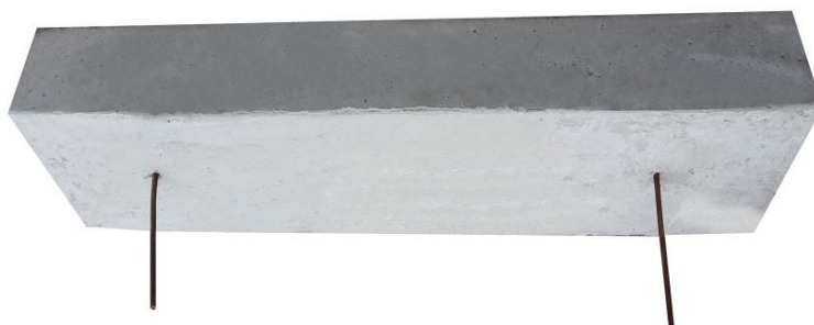
Imagem 07: referência para bate rodas.