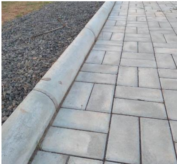
Imagem 04: referência para assentamento de meio fio liso em concreto pré-moldado, 08x25x80cm.

8ª etapa: O terreno deverá ser umedecido, com caminhão pipa, e compactado com uso de rolo compactador.