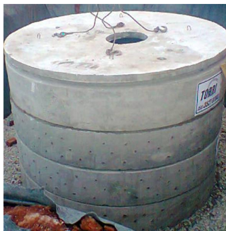
Imagem 01: referência para execução de sumidouro pré-moldado com tampa de concreto armado.

5ª etapa: Toda a água captada será conduzida para 04 sumidouros de concreto armado pré-moldados, com diâmetro de 160cm, e perfurado para que a água também percole através das paredes. Os sumidouros possuirão 04 metros de profundidades, conforme referência abaixo: